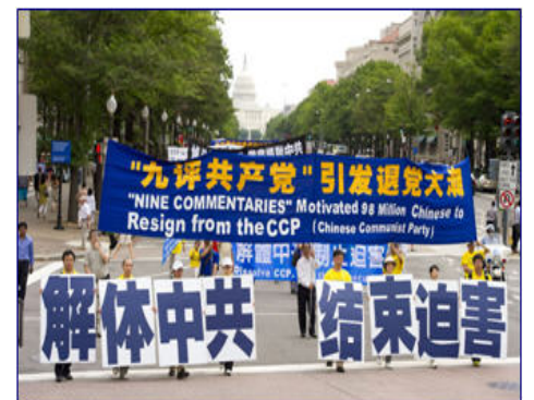
图:二零一一年七月十五日,声援三退的游行队伍在美国华盛顿DC的大道上行进。◇

共迫害法轮功学员,助纣为虐,殊不知善恶有报是天理,迫害善良者终将受到天理的制裁,也不会逃脱人间正义的审判。◇