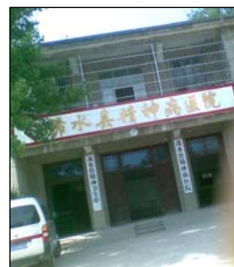
图：浠水县精神病院 左图：酷刑演示：打毒针（注射不明药物）

射催眠镇静的药物。几天后，我找机会走脱，精神病院又将我抓回。我绝食抗议，他们就强制打点滴，打点滴后，我感到十分难受，头象要炸开，人迷迷糊糊的，站起来就摔倒在地。三