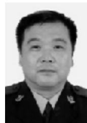
瑞昌市公安局 局长李九萍