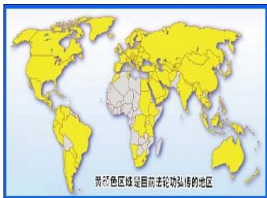
左图：世界各国的法轮功学员在炼功