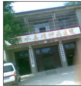
图:浠水县精神病院 左图:酷刑演示:打毒针(注射不明药物)

中共江氏集团采用流氓手段疯狂迫害法轮功以后,我三次被投入县精神病院。第一次,医生用镇静剂把我催眠,然后给我打点滴,使我昏死过去几天。醒来后又将我绑在床上,用电针电我,问我还炼不炼,我说炼,就不停地电我。第二次是 2002 年 10 月 26 日,检察院、政保科、610 以“十六大要召开”为由,将我从劳教所强行抬入县精神病院,绑在病床上,注