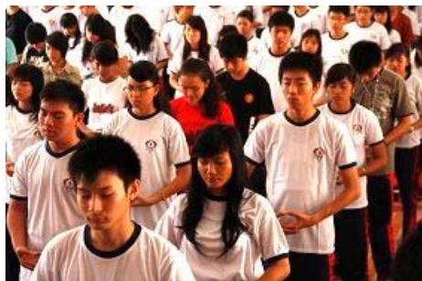
图：天主教高中的学生正在学习法轮功

来自捷克的艾诺曼先生签名支持 232 号决议案并告诉记者，他能理解法轮功学员在共产国家遭受迫害的情形，因为二十五年前他也从当时共产铁幕统治下的捷克逃离，明白共产专制是怎么回事。他指出：“被挤压的人民对共产主义都很厌恶”。◇