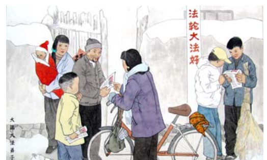
绘画：大法福音救世人

以上这些法轮功学员，她们都是正直、善良的公民，信仰法轮功使她们身心净化，她们只是想把亲身受益的事实让民众分享，把美好带给身边的人。监狱本是关押犯人的地方，是中共发动的这场对信仰“真、善、忍”的迫害，把这些好人劫入监狱。天理不容啊！法轮大法的美好以及被迫害的真相已经传遍了全世界，对行恶者进行审判的日子已经不远了。善良的人们，请向这些好人伸出援手，也是在维护我们自己的权益和未来！