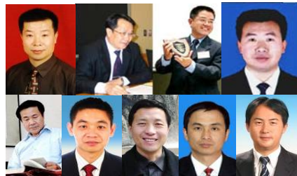
图：部份为法轮功学员做无罪辩护的大陆律师（左起）：

◆ 法轮功学员有信仰自由和传播信仰的自由。他们散发资料从不构成任何犯罪。他们做讲真话的好人，从来没有危害其他人，没有