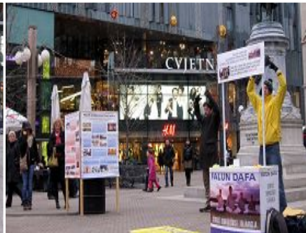
图: 法轮功学员在市中心广场讲真相, 反迫害

炼功、发正念。有学员过去给在旁边执勤的几位警察送真相资料。领头的警察接过去了, 其他警察也伸手接了。警察说: 你们的传单颜色变了。学员说: 你们很熟悉我们的真相资料, 那你们知道中共对法轮功的迫害吗? 警察说: 我们当然知道了, 中共独裁, 无故杀人, 我们肯定不支持中共滥杀无辜。上面让我们过来看看, 这是我们的工作。学员讲法轮功的真相, 警察都认真地听着。