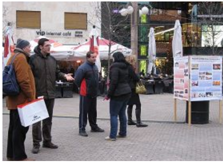
图：克罗地亚法轮功学员在市中心广场讲述法轮功以“真、善、忍”为原则，而以暴力和谎言维持统治的中共不能容忍亿万民众对“真、善、忍”的信仰和追随，所以发动了迫害。

一个华商会长跑过来说：共产党啥样，我们知道。出来了，就要维护祖国的声誉。你们这样做不好，是搞政治，不爱国，大使馆要是知道就麻烦了。义工说：天要灭中共，我们是劝大家远离邪恶，保平安。这和你说的搞政治不是一回事；共产党坏事做绝，你爱它吗？爱党和爱国也不是一回事。中使馆的人要是阻止“三退”，