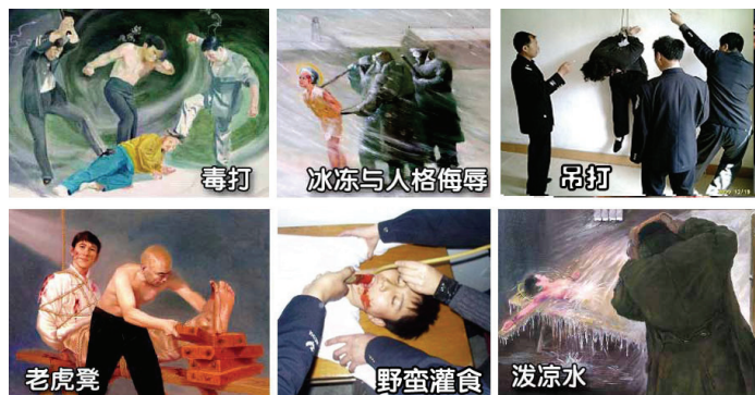
法轮功学员遭受的部分酷刑

命令中，被公安不法人员绑架后，酷刑逼供中受尽了折磨，有的在痛苦中失去了生命；有的被劫持到洗脑班、看守所、劳教所、监狱迫害；有的被强行注射破坏神经系统的药物致使精神失常成了废人；有的被残酷迫害致伤致残；有的甚至被活活打死，使得无数法轮功学员妻离子散、家破人亡。