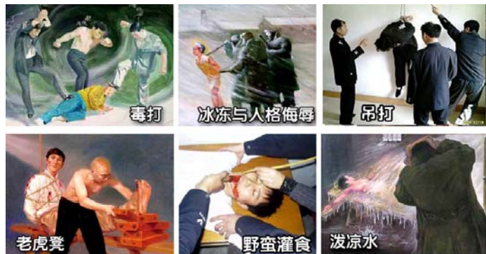
法轮功学员遭受的部分酷刑

命令中，被公安不法人员绑架后，酷刑逼供中受尽了折磨，有的在痛苦中失去了生命；有的被劫持到洗脑班、看守所、劳教所、监狱迫害；有的被强行注射破坏神经系统的药物致使精神失常成了废人；有的被残酷迫害致伤致残；有的甚至被活活打死，使得无数法轮功学员妻离子散、家破人亡。