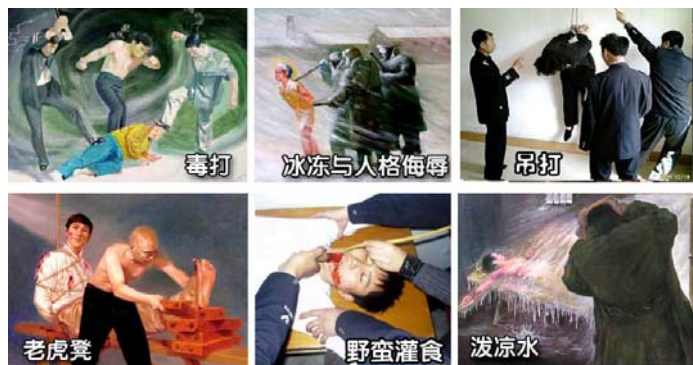
法轮功学员遭受的部分酷刑

命令中，被公安不法人员绑架后，酷刑逼供中受尽了折磨，有的在痛苦中失去了生命；有的被劫持到洗脑班、看守所、劳教所、监狱迫害；有的被强行注射破坏神经系统的药物致使精神失常成了废人；有的被残酷迫害致伤致残；有的甚至被活活打死，使得无数法轮功学员妻离子散、家破人亡。