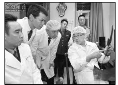
图：王立军(右)指示重庆警局加快无创伤解剖的实践应用

因此，我们要求国务院公布其获得的有关发生在中国的滥用移植器官的行径，包括王立军提供给美国驻成都领事馆的文件。