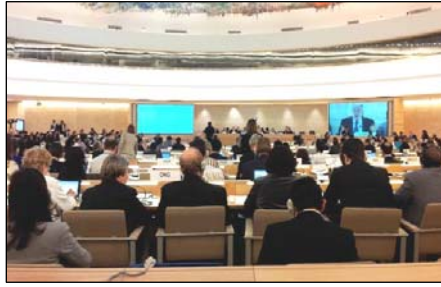
图：日内瓦万国宫举办的国际人权事务报告会，谴责中共活摘器官罪行。

器官移植是现代医学最伟大的进步之一。按照道德标准操作，器官移植可以挽救而且已挽救了成千上万人