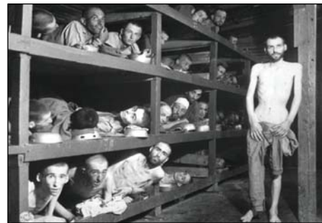
图: 被解救的布痕瓦尔德集中营囚犯

1945年4月的德国魏玛。在这座以巴赫的音乐、歌德的小说、席勒的诗篇以及包豪斯的建筑而闻名世界的城市中, 却有着的一座纳粹兴建的臭名昭著的布痕瓦尔德集中营。从1937-1945年间约有5.6万人在这里被迫害致死。当美军士兵解放集中营时, 被看到的恐怖景象完全惊呆了: 还没来得及焚烧的尸体到处堆积, 两万多名囚犯奄奄一息。