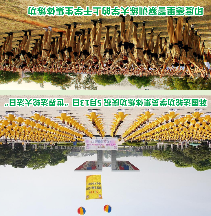
印度德里警察训练大学的上千学生集体炼功

在同根同源的台湾，1000多个法轮功炼功点遍及全岛300多个乡镇，修炼者多达几十万入，涵盖大学教授、政府官员、普通民众等各个阶层。修炼者身强体健，心性道德提升，普遍受到政府部门及社会各界的高