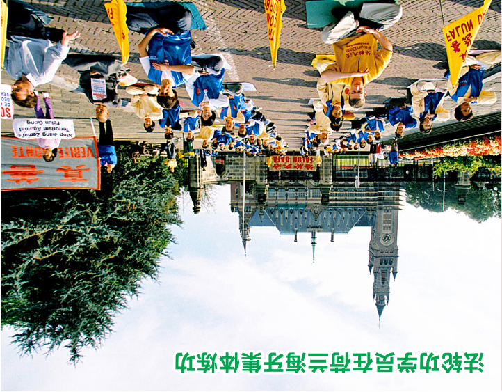
法轮功学员在荷兰海牙集体炼功

在欧洲，法轮大法已传至40多个国家，法轮功学员的集体炼功、节日游行、真相图板、文艺演出、美术巡展……早已成了欧洲世界里独特的风景。