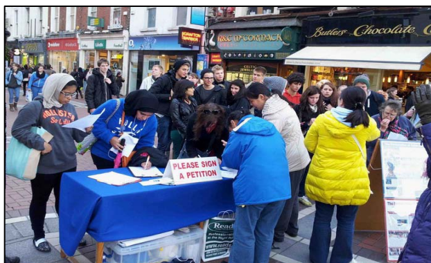
图：爱尔兰民众纷纷签名吁彻查中共活摘器官罪行

为了让更多的人了解这场发生在中国持续了十三年多的，现在仍然继续地对法轮功学员进行惨绝人寰的血腥迫害，爱尔兰很多当地学员，有的请假，有的甚至带着孩子前来参与每天的讲真相和征签活动。善良的爱尔兰民众被法轮功学员的平和、善良和坚持所感动，纷纷表示签名支持制止迫害，几天的时间就征集了两千多个签名。