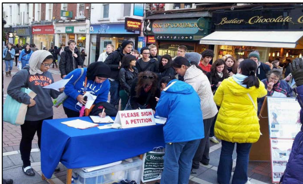
图：爱尔兰民众纷纷签名吁彻查中共活摘器官罪行