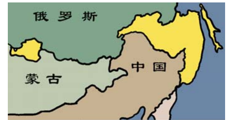
至少达100多万平方公里被侵占的中国领土被江泽民正式划入俄罗斯

文化、维护中华民族的领土与主权！ 中共在历次运动中害死炎黄子孙八千万；将数千年来中华民族的主流文化儒、释、道三教齐灭；认同前苏联将外蒙从中国分裂出去，使外蒙一百六十万平方公里的领土及主权永远被出卖！前中共党魁江泽民总共出卖了东北地区一百四十多万平方公里在历史上有争议的疆土给俄国，相当于四十个台湾的面积。