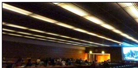
图：影片《自由中国》、《生死之间》在日内瓦联合国人权理事会大会的会场——万国宫内放映。

该影片从近十年来中国的器官移植手术量暴增和超短的等待器官时间谈起，展开了对大量的不明器官供体的调查。通过分析中共官方的器官移植数据及媒体报导，采访大量调查人员、专家和证人，证实了中共政权为了牟取暴利，系统建立法轮功学员及其他政治犯活体器官库，按需杀人、活体摘取器官的惊天罪行。◇