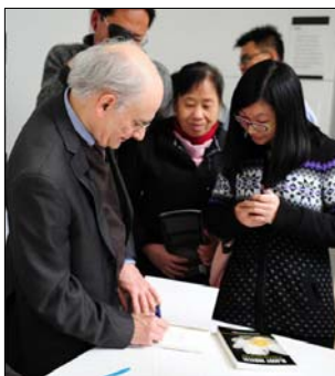
图：《国家器官》新书发行演讲会上