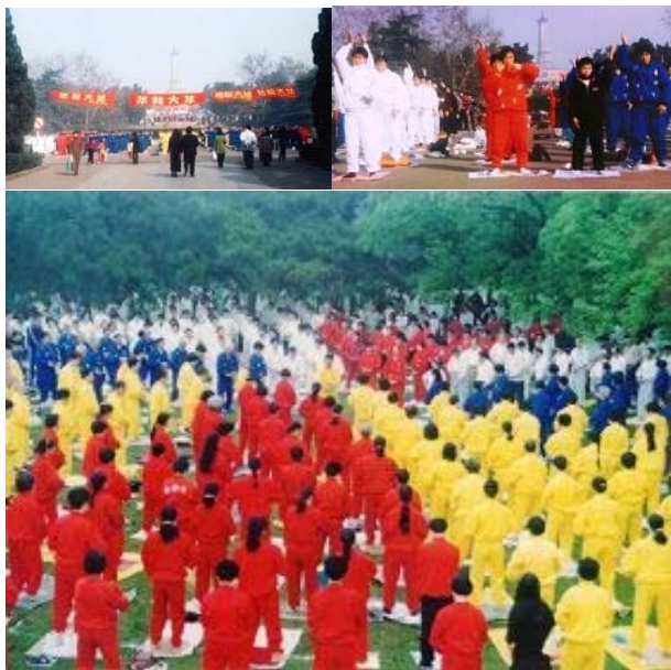
历史照片：九九年七月之前，在公园集体炼功的情景

【明慧网】光阴荏苒，许多往事早已湮没在岁月的风尘中，但对于许多长沙市的法轮功学员而言，他们永远也不会忘记，一九九九年七月之前，在长沙市烈士公园炼功点参加晨炼的美好记忆。（注：所谓“烈士”是被中共驱使为其在内战中付出生命的中国人，是中共的受害者）。