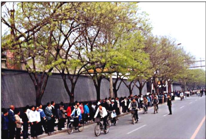
图：秩序井然的四·二五上访民众