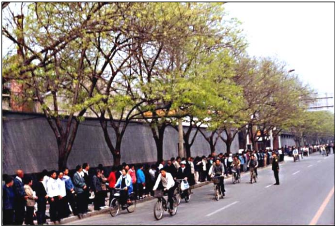
图：秩序井然的四·二五上访民众