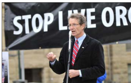
图：亚省省议员大卫·斯旺博士发言

亚省省议员，前自由党领袖大卫·斯旺博士在集会上呼吁加拿大政府对中共迫害法轮功修炼者事件进行调查，必须制止这一长期的迫害。“与一个无论是制度、劳工、环境以及人权等等方面都不同的国家交易，不利