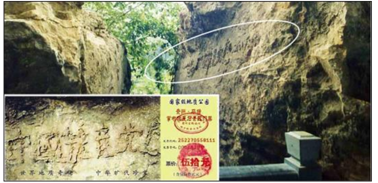
图：2002 年 6 月在贵州省平塘县掌布乡发现的二亿七千万岁的“藏字石”，天然形成的“中国共产党亡”六个大字，昭示着天灭中共的天意。上图为“藏字石”和风景区门票。

做一个好人的法轮功学员，据不完全统计，已被证实的有 3000 多名法轮功学员被迫害致死，几十万法轮功学员被判刑、劳教、送洗脑班，送精神病院，甚至活体摘取法轮功学员器官，高价卖给外国人和有钱的中国人牟取暴利。