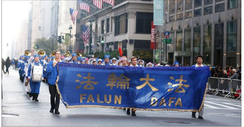
二零一二年纽约老兵节游行中法轮功学员的队伍

到的是我们邀请到的法轮大法游行队伍，他们是退伍军人节游行的老朋友，他们传递着‘真、善、忍’的美好信息，请大家掌声欢迎他们！”