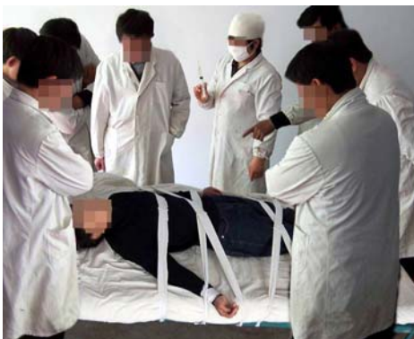
酷刑演示: 打毒针 (注射不明药物)