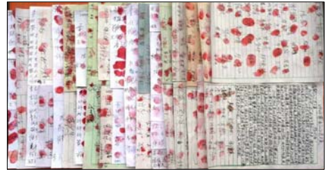
图:湖南郴州超过二千百姓签名声援营救被绑架的法轮功学员

征签过后,有个人写了一封感谢信,信中说:“我亲身接触了法轮功修炼者,他们是一群非常善良,非常乐于助人的好人。中共无情地迫害着