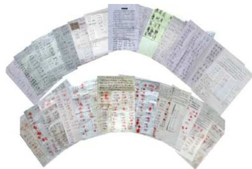
图：第四轮河北 1108 民众声援法轮功学员

夫妻俩从大法中受益了，当然知道法轮功学员受迫害是冤枉的，因而签名营救同样修炼法轮功的大好人李兰奎，这本是一件善良的义举，然而，八月七日晚却被河北省国安、河