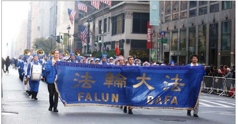
二零一二年纽约老兵节游行中法轮功学员的队伍

到的是我们邀请到的法轮大法游行队伍，他们是退伍军人节游行的老朋友，他们传递着‘真、善、忍’的美好信息，请大家掌声欢迎他们！”