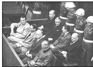
图：纽伦堡审判图片。二战结束后，纽伦堡国际军事法庭否决了迫害帮凶们“奉命行事”的辩解。

如今对这个信仰真、善、忍团体的迫害，已经延伸到中国社会的各个层面，成为对全体中国人的打压。许多因为冤情而上访的访民，都是被关