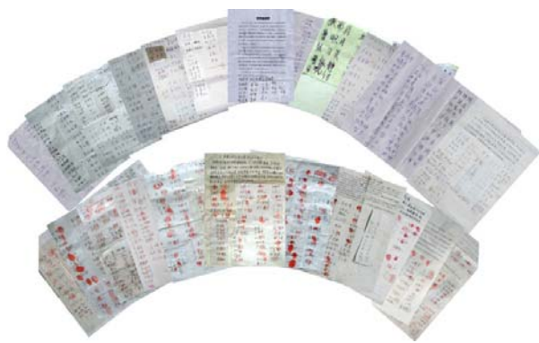
图: 第四轮河北 1108 民众声援 700 手印

有两位四十多岁的男士听到有人说起签名的事,一个说:“好说好听,我签。”另一个说:“我也签,共产党这么坏,贪污腐败早该淘汰