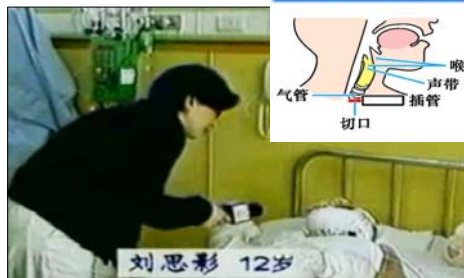
气管切开通管示意图

国际教育发展组织（IED）2001年8月14日在联合国会议上，就天安门自焚事件，强烈谴责中共的“国家恐怖主义行为”。声明说：从录像分析表明，整个事件是“政府一手导演的”。中国代表团面对确凿的证据，没有辩辞。该声明已被联合国备案。