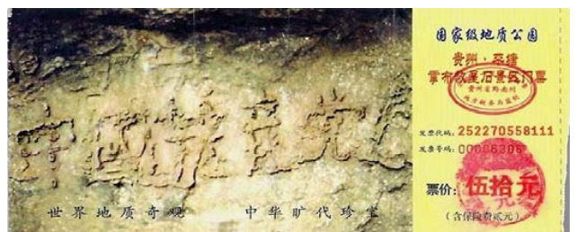
图：贵州平塘县掌布乡藏字石风景区门票

中国人在加入少先队、共青团、共产党时，都曾宣誓要为其奋斗一生，献出生命，这等于是发了一个毒誓，如果不退出，就是它的一份子，就要分担它的罪恶与恶果，就会在天灭中共的天象变化中遭劫难。所以法轮功学员讲真相、劝“三退”（退党团队），与“搞政治”毫不沾边，他们是在救人！让人在天灭中共时不做它的陪葬，从而有个美好的未来。◇