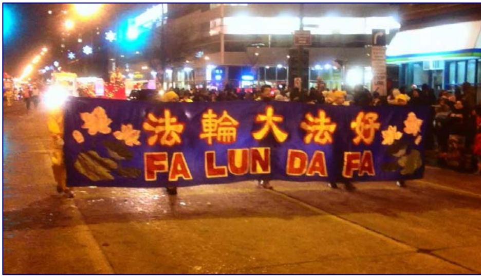
图：法轮功学员参加加拿大温尼伯二零一二年圣诞游行

用海外电子信箱给 freeget.ip@gmail.com 发电子邮件，10 分钟内会拿到几个 IP 地址（标题不可空白）。突破网络封锁，访问明慧网 www.minghui.org 了解更多真相！