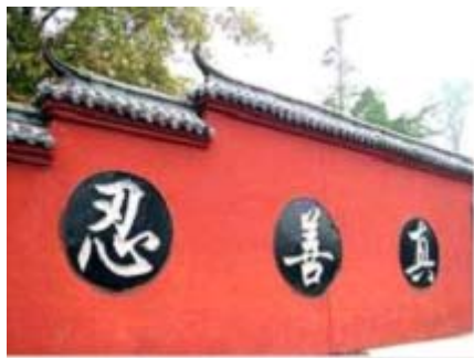
▲ 建于明代龙泉寺西墙壁上过去雕刻了“真、善、忍、精、气、神”六个大字。

很多人都觉得奇怪，中共为什么会如此惧怕“真善忍”这三个字呢？以至于要在媒体、网络等任何地方全面封杀。其实道理很简单，打压