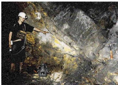
图：美国航天局 2005 年 2 月 20 日公布 20 亿年前的核反应堆图片。

法国政府宣布了这一发现，震惊了世界，并吸引了各国的科学家们来到奥克洛研究，研究成果在 1975 年国际原子能委员会的一个会议上公布：这是一个大型的、天然核反应堆，由六个区域约 500 吨铀矿石构成，输出功率估计为 100 千瓦。核反应堆为二