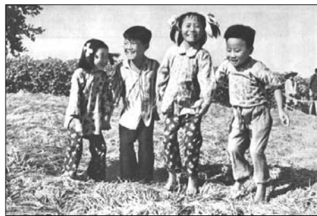
图：压不倒的稻子。当年中共媒体为渲染亩产万斤，连篇刊登如此“新闻”，小孩站在稠密的稻子上面，稻子不倒。随后，中共的大跃进运动登场，导致的大饥荒使数以千万计的百姓饿死。

反观中共历史,骗爱国青年奔延安,骗志愿军奔朝鲜,骗知识份子说真话……结果这些人却被杀戮;今天工人失业,农民失地。中共的历史就是谎言史。暴力和欺骗,造就了今天“啥也不信”的社会风气。◇