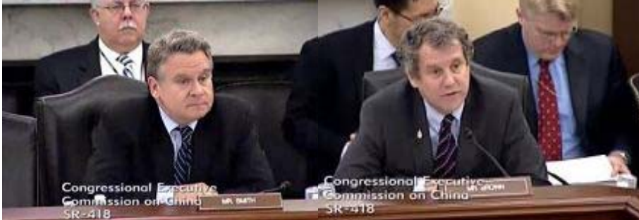
▲委员会及行政当局中国委员会主席克里斯·史密斯议员