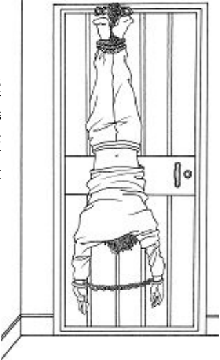
中共酷刑示意图：“倒挂”