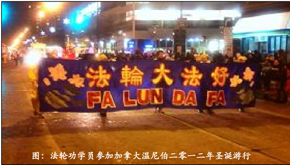
图：法轮功学员参加加拿大温尼伯二零一二年圣诞游行