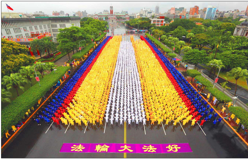
图：六千多名法轮功学员在总统府前的凯达格兰大道上集体炼功