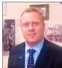
图：苏格兰议会议员鲍勃·多瑞斯

近来，由多个国家医生组成的国际组织“医生反对强制摘取器官协会”发起了请愿书，促请联合国派出独立调查组对中共活摘器官的暴行