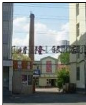
左图：位于齐齐哈尔市劳动桥附近的晴隆旅店便是洗脑班