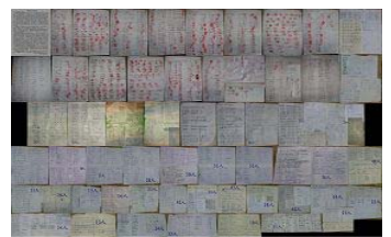
秦皇岛 2300 民众联名营救

面对这样险恶的现实，面对根本就不准备讲法律的政府部门去申诉，对于刚刚走出冤狱依然虚弱的我，是那样沉重……然而申诉是没有错的，也不仅仅为了珊珊，这颠倒的一切，是不能够接受，不能够承认的。为了营救我，不光亲友付出努力，甚至乡亲、更多素不相识的民众，甚至海外正义力量（如国际大赦，致信中共要求释放我），都以正义的