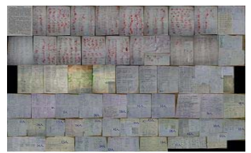
秦皇岛 2300 民众联名营救

面对这样险恶的现实，面对根本就不准备讲法律的政府部门去申诉，对于刚刚走出冤狱依然虚弱的我，是那样沉重……然而申诉是没有错的，也不仅仅为了珊珊，这颠倒的一切，是不能够接受，不能够承认的。为了营救我，不光亲友付出努力，甚至乡亲、更多素不相识的民众，甚至海外正义力量（如国际大赦，致信中共要求释放我），都以正义的