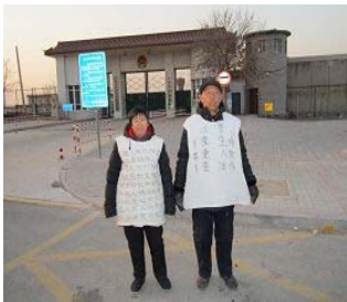
狱门前为救儿命身穿状衣的父母

由于控告，和民众联名申诉的压力，天津检察院，监狱管理局对港北监狱做了调查，但是并不对律师及家属提供的证据线索予以调查，同时默许监狱阻