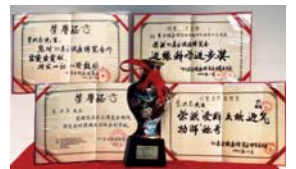
1993年北京健康博览会上，李洪志先生获“边缘科学进步奖”和“受群众欢迎气功师”称号。

● 法轮大法弘传世界 法轮功至今已弘传一百多个国家和地区（包括台湾、香港、澳门），法轮功的书籍被译成30多种语言出版发行，并可在互联网