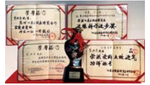
1993年北京健康博览会上，李洪志先生获“边缘科学进步奖”和“受群众欢迎气功师”称号。

● 法轮大法弘传世界 法轮功至今已弘传一百多个国家和地区（包括台湾、香港、澳门），法轮功的书籍被译成30多种语言出版发行，并可在互联网