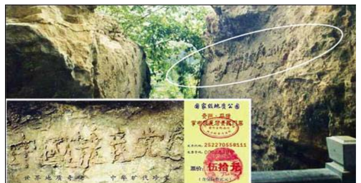
图为“藏字石”照片, 小图为“藏字石”风景区门票。

希望善良、理性的乌鲁木齐父老乡亲, 一定要分清善恶正邪, 认清中共的所谓“承诺卡”签名活动的害人伎俩, 做出正确的选择。愿您拥有美好的未来。◇