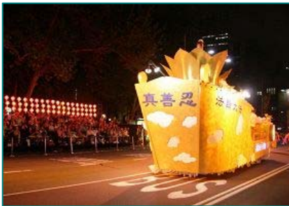
■法轮功学员制作的精美花车