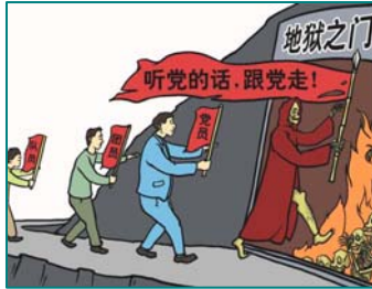
漫画：听党的话 跟党走 走入地狱门

中共迫害法轮功以来不论以何种形式制定了什么“法律”，或者采用已有的法律，都是严重的践踏人权，从根本上毁坏人类的道德，就其本质而言是一种远超纳粹恶行的犯罪。也就是说，这些所谓的“法律”本身就是恶法，其立法过程就是其犯罪的过程。近几年，江泽民、罗干、周永康、薄熙来等三十余名中共高官因迫害法轮功罪行，已在世界三十多个国家被以“反人类罪”或“群体灭绝罪”告上了法庭，王立军的被捕，也是清算那些参与迫害法轮功的开端。中共一直用谎言和暴力来维持其统治，在一次次政治运动中造成八千万善良百姓的非正常死亡，遭到上天的清算是中共逃脱不了的命运，所有参与中共及其附属组织的人也难逃脱厄运，为了自救，全球已有超过一亿一千万人退出党团队，不在与邪党为伍，为自己选择一个美好的未来。那些没有认清中共继续迫害法轮功的人要停止作恶，退出中共，用行动救赎自己的生命，时间不等人啊。◇