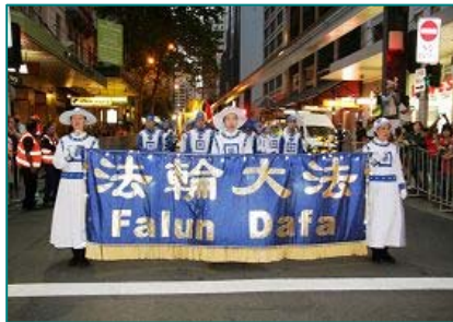
■法轮功学员天国乐团