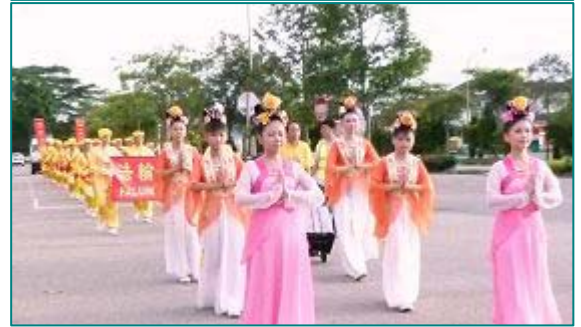
■由法轮功学员组成的新年的游行队伍