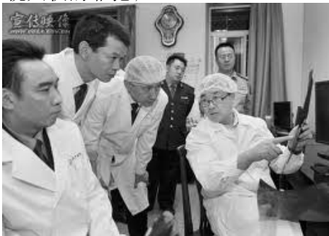
图：王立军（右一）2008 年 6 月调任重庆，指示重庆警局要加快无创解解剖的实践应用

2012 年 2 月 6 日，现任重庆市副市长，前重庆市公安局局长王立军突然进入美国驻成都领事馆，紧接着重庆市政府宣布王立军接受“休假式治疗”。王立军进得了领馆，却得不到庇护，其重要原因之一就是参与迫害法轮功，美国是以信仰自由和人权为立国之本的国家，怎么会庇护一个手上沾满鲜血，迫害信仰者、无视人权的罪犯呢？