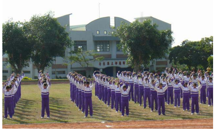
图：二零零九年十二月十一日，台湾台东县都兰国中校庆运动会开幕典礼上全校一百多位学生表演了法轮功五套功法，动作整齐、优美，让家长 and 来宾十分赞叹。