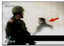
4、击打者仍保持用力姿势

进东却仍坐地轻松自如。警察本来是不背着灭火器巡逻的，所谓“自焚”当天，警察几分钟内从两辆警车里拿出二十多个灭火器和灭火毯应付“自