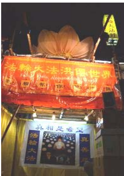
法轮功真相摊位引人注目

人数更胜往年，人潮在除夕夜尤其爆满，法轮功真相摊位前经常挤得水泄不通，民众争相向法轮功学员拿取制作精美、挂着真相书签的小莲花，接过后兴高采烈，有些人更如获珍宝般放进随身袋子里，或者仔细念出书签上的“法轮大法好”字句。不少人提出要多拿几朵，转赠给亲朋好友；亦有市民主动挤过人群，来到摊位前，希望了解法轮