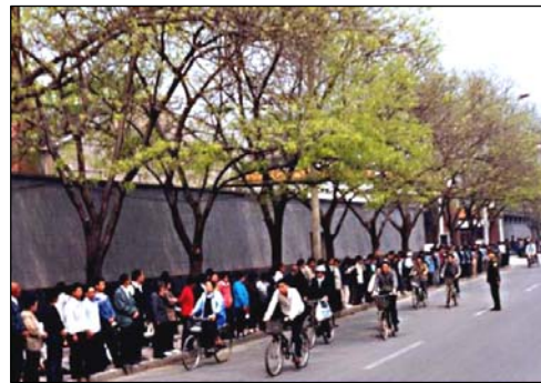
图：四·二五上访现场秩序井然

● 当法轮功学员要求放人时，在天津市政府被告知，公安部介入了，如果没有北京的授权，被抓捕的法轮功学员不会得到释放。天津公安向法轮功学员建议：“你们去北京吧，去北京才能解决问题。”