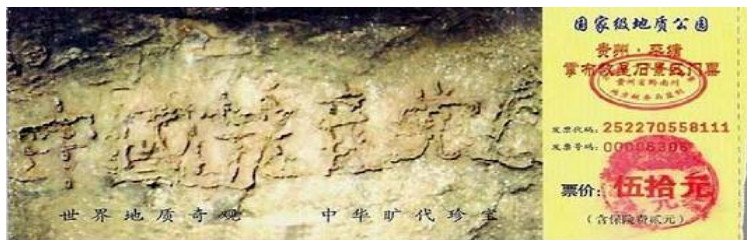
图：风景区门票。2002 年 6 月，贵州平塘县掌布乡发现了距今二亿七千万年的“藏字石”，石头断面上显现“中国共产党亡”六个大字，后被中科院地质专家鉴定为天然形成。