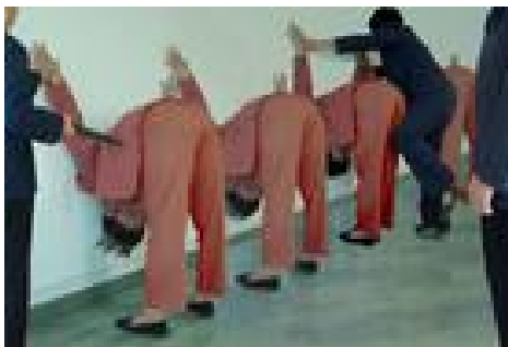
演示吉林省女子监狱迫害手段