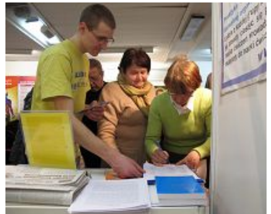
左图：法轮功学员在博览会上向波兰民众介绍法轮功