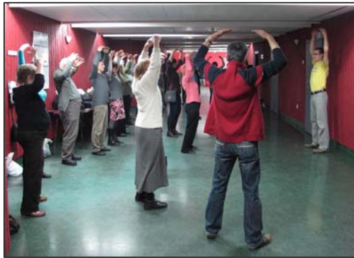
图：波兰民众学炼法轮功