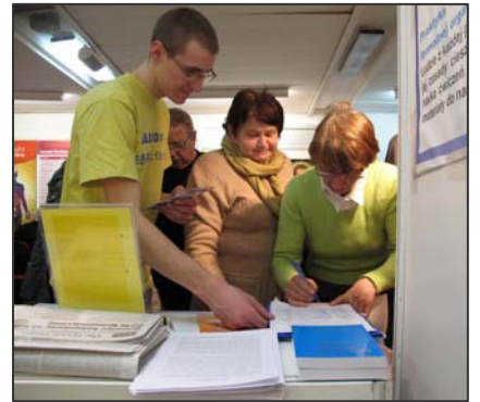
图：波兰民众签名反对中共迫害

台上索取相关资料，法轮功学员为此准备了波兰语、英文、德文、法文和中文等多语种法轮大法传单，让更多的人了解法轮大法。◇