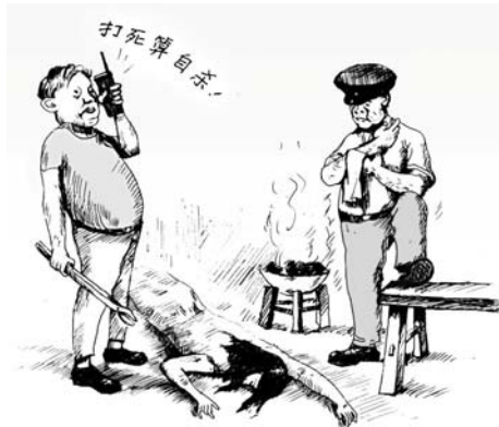
漫画：610 的指示 2005.2.15