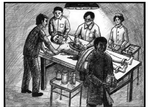
中共活体摘取法轮功学员器官示意图