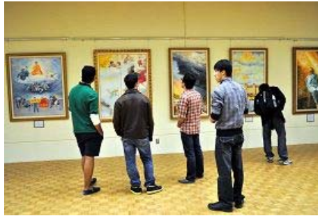
图：大学师生参观真善忍美展

伴随着悠扬的音乐，整个展厅平和安详。早上，美展刚开始不久，卑诗省大学的一些教授和学生就纷至沓来，有一位教师带领全班学生来参观美展，还有很多卑诗省大学艺术系和音乐系的学生慕名而来。很多华裔的留学生和大陆华人也前来观看真善忍美展，并且有大陆华人详细询问美术作品的细节以及法轮大法的真相。