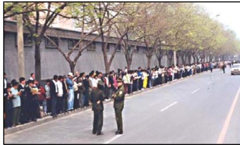
图：四二五逾万名法轮功学员和平上访

“四二五”上访的起因是，中共头目罗干的连襟何祚庥在天津教育学院《青少年科技博览》杂志上发表文章，捏造事实诽谤法轮功。天津部份法轮功学员向有关部门反映情况，希望澄清事实，天津公安局却以反常的态度动用防暴警察，殴打法轮功学员，并非非法抓捕四十多名法轮功学员。还说：你们去北京吧，去北京才能解决问题。于是，法轮功学员们怀着对政府的信任，自发来到北京信访办，寻求“天津事件”的公正解决。四月二十五日，万名法轮功学员从各地赶到北京，中午时分，时任国务院总理亲自接见了法轮功学员代表，下令让天津公安局放人，并重申了国家不会干涉群众炼功的政策。