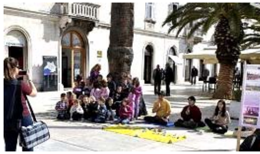
学校的老师带着孩子来学炼法轮功。