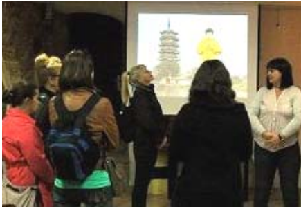
参观者在学习法轮功功法。

用海外信箱给 freeget.ip@gmail.com 发电子邮件，十分钟内会拿到几个 IP。突破网络封锁，访问明慧网 www.minghui.org ，了解更多真相。